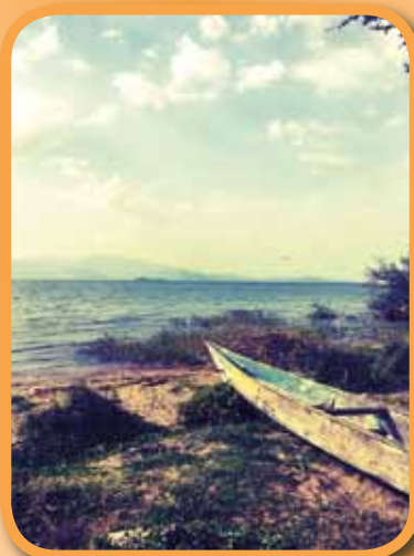
Rozjezd dvouletého projektu klecového chovu ryb podpořeného grantem SlovakAid