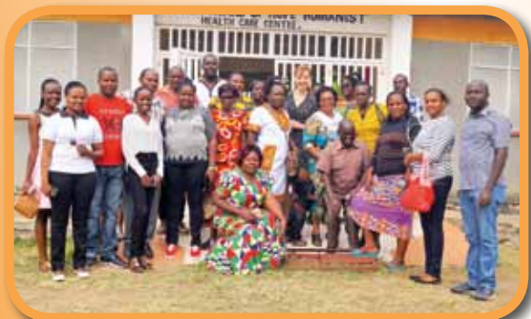
Seminář s koordinátory projektu adopce na dálku

Klub přátel Ostrova Naděje hledá další dobrovolníky, sponzory a přátele, kteří by se chtěli aktivně podílet na vytváření tohoto rozvojového projektu a napomoci jeho dalšímu rozvoji a směřování k samostatnosti a trvalé udržitelnosti.