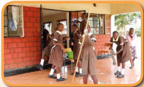
Velký úklid a přípravy na slavnost