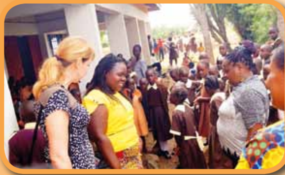
Seminář s učiteli a příprava ucelené výuky sexuální výchovy