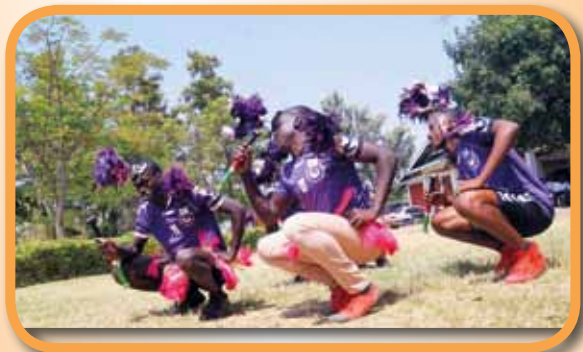
Slavnost u příležitosti nového školního roku a dokončení stavby střední školy