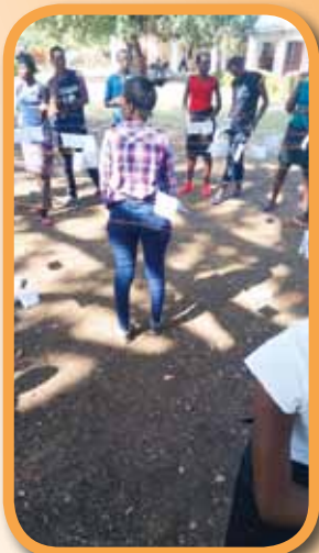
Seminář se studenty střední školy