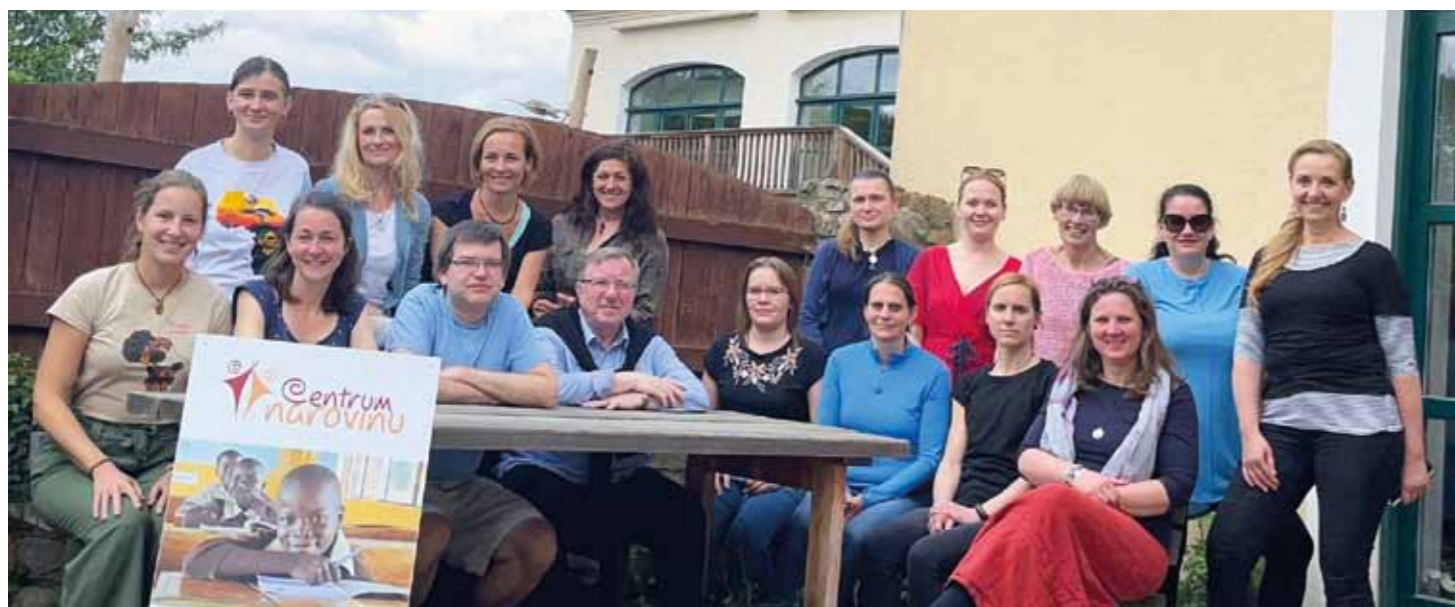
Z květnového setkání s našimi dobrovolníky v České republice

Básničky mě moc baví a všem kamarádům skládám třeba k narozeninám, tak jsem jednu udělala i pro Centrum Narovinu.