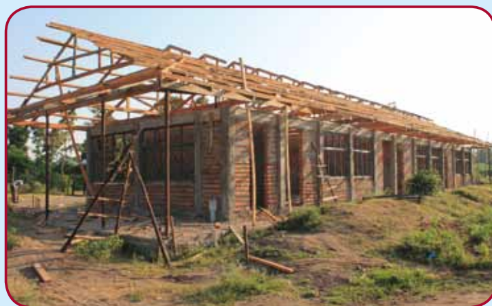
první budova učeben - zde budou laboratoře a jedna učebna