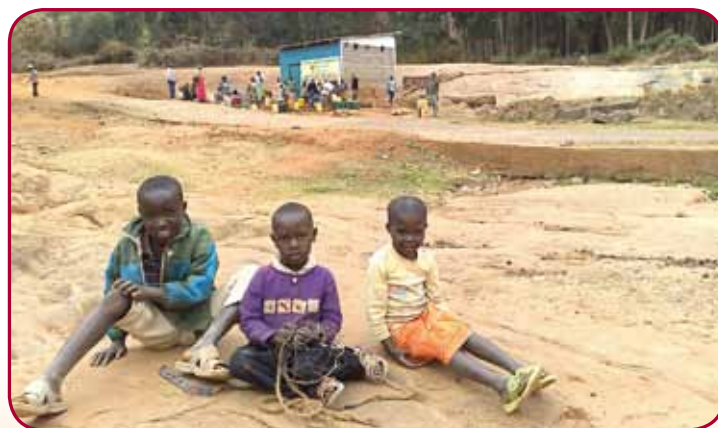
Projekt Voda pro Kauti změnil místním lidem život.