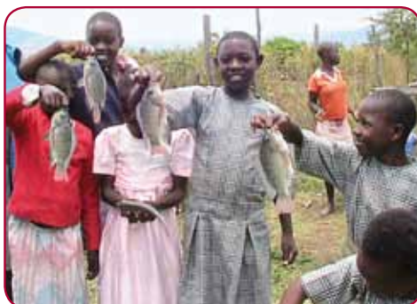
Ryby z místního rybníka jsou pro projekt velkým přínosem.