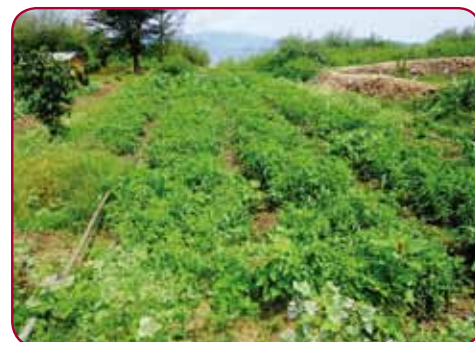
Ovoce a zelenina ze školní zahrady obohacuje jídelniček.