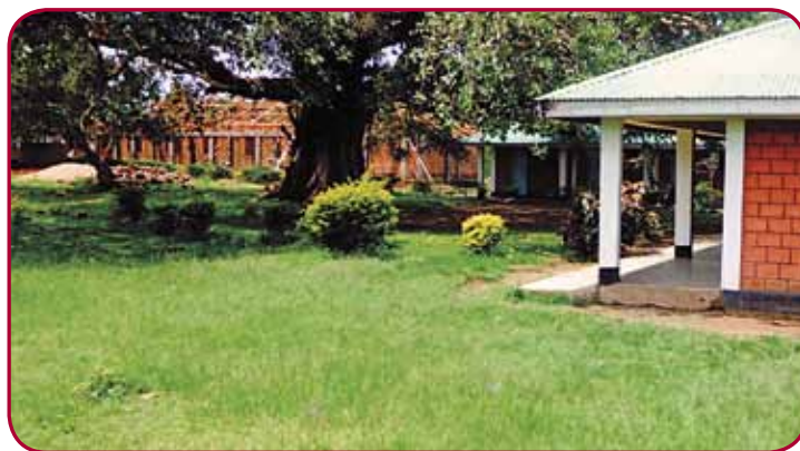
S podporou SlovakAid rozšiřujeme kapacitu Ostrova naděje.