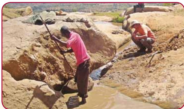
Komunita v Kauti se podílí na výstavbě závlahového systému.