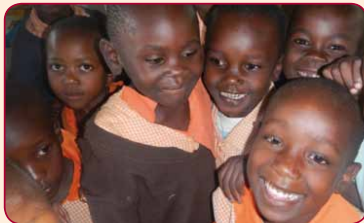
Děti mají velkou radost, mohou být ve škole a učit se.