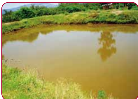
Ostrov naděje dostal od vlády další chovný rybník.