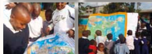
Výukové pomůcky vyrobené dětmi v ČR pro keňské školy