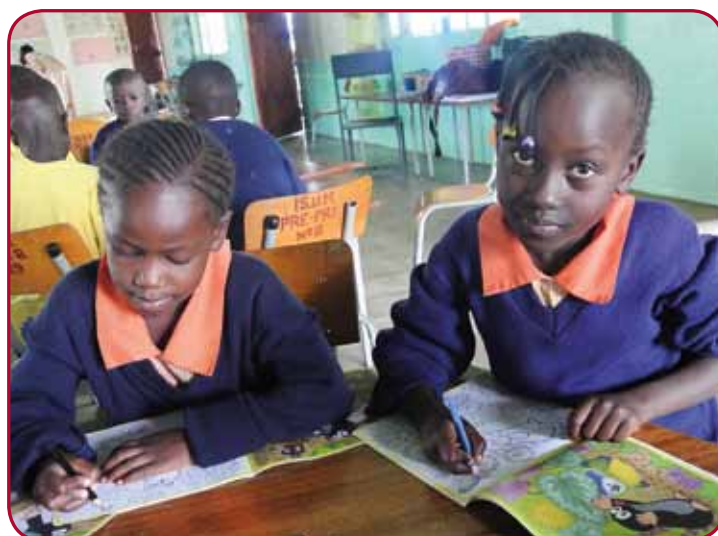
I jednorázová pomoc dětem velmi pomůže.

Poslat je možné jednorázovou částku, pravidelné či nepravidelné částky během celého roku.