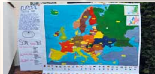
Komunikace mezi dětmi – dopisy, obrázky, vlastnoručně vyrobené dárečky...