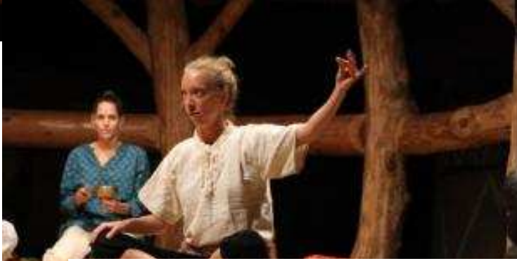
Divadlo vytáhlo všechny trumfy z rukávu a rozehrálo sedm báječných bajek.