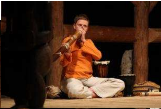
Staccato bubnů rozeznělo celou zoo!