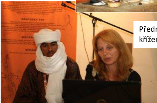
Přednáška střídala přednášku. Procestovali jsme tak celý africký kontinent křížem krážem!